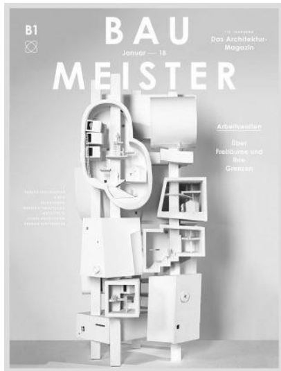
Baumeister- n°1/2018 Environnements de travail