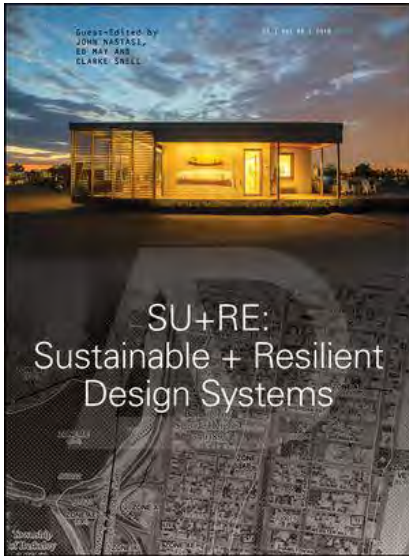
Architectural Design – n°1/2018 Sustainable + Resilient Design Systems