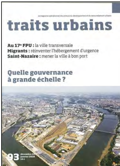
Traits urbains - n°93 Quelle gouvernance à grande échelle ?