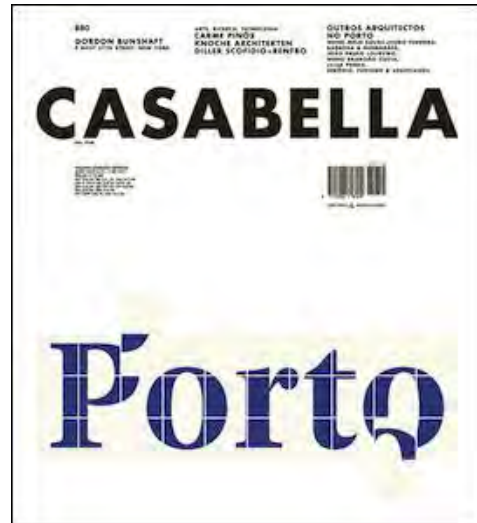
Casabella n°887 Porto