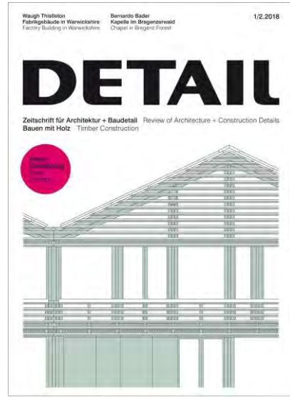
Detail – n°1-2/2018 Construction bois