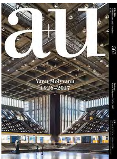
A+U - n°567 Vann Molyvann 1926-2017