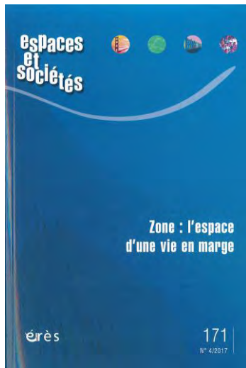
Espaces & sociétés - n°171 Zone : l'espace d'une vie en marge