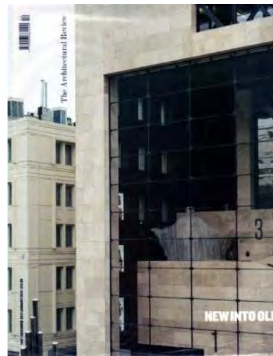
Architectural Review - n°1427 New into Old