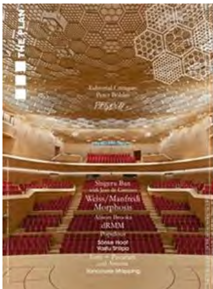
The Plan- n°12/2017