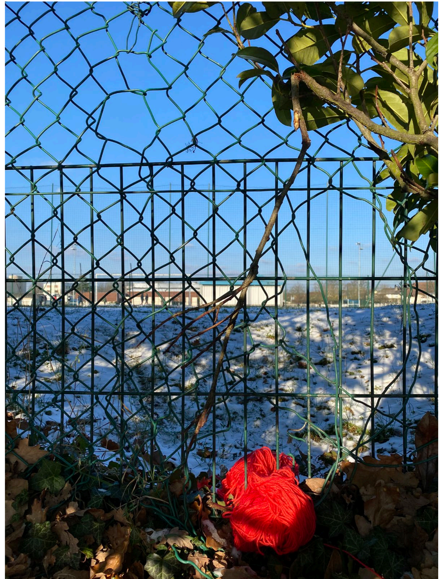
Photographie documentaire de la grille et du fil rouge