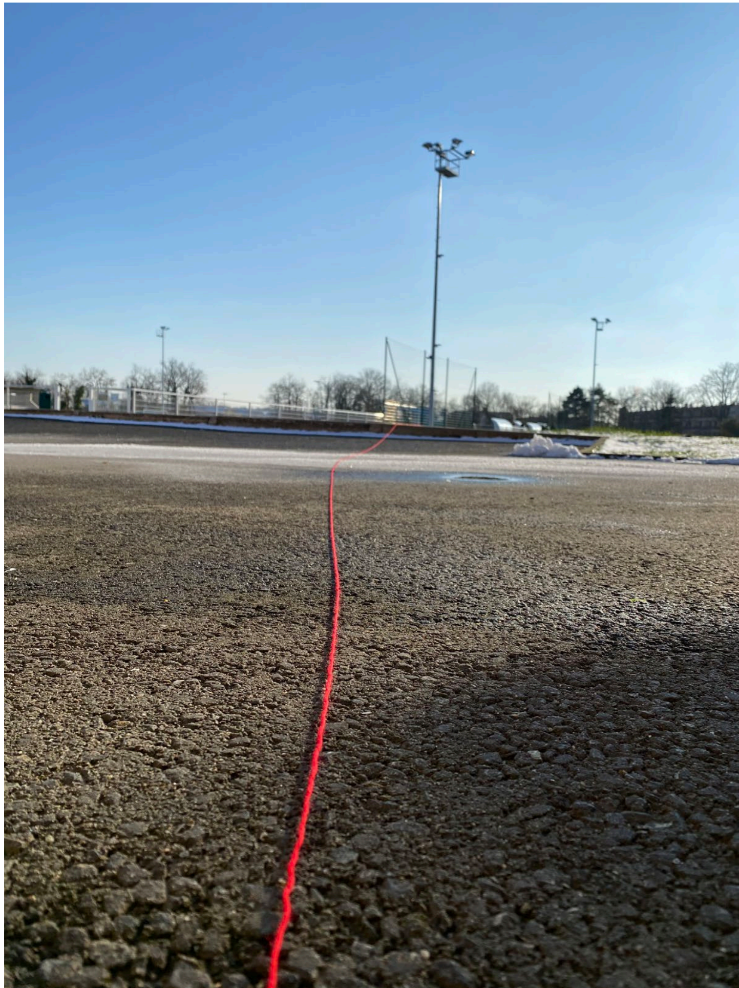
Photographie documentaire du fil sur la route