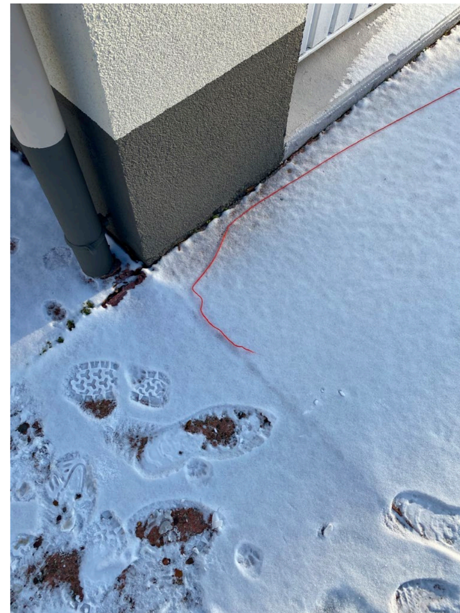
Photographies documentaires du fil coupé