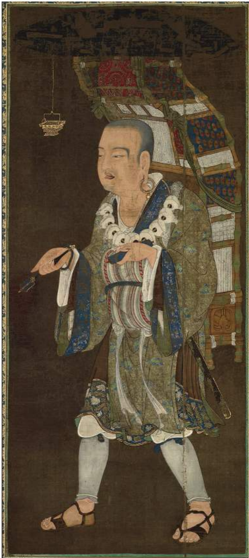
Xuanzang - Personnage de Pérégrination vers l'ouest .