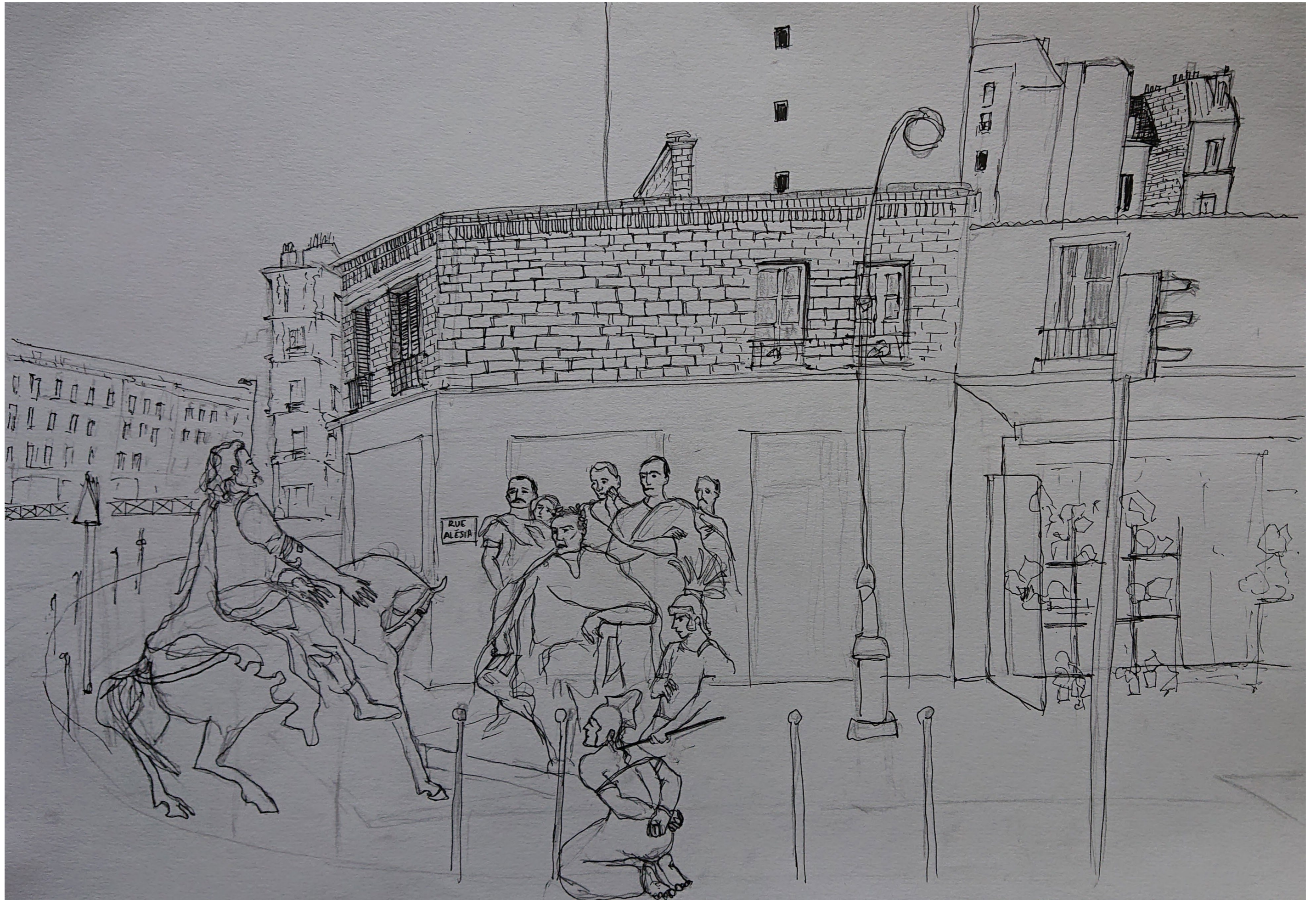
Bataille d'Alésia (inspirée du tableau de Lionel Royer) transposée rue d'Alésia