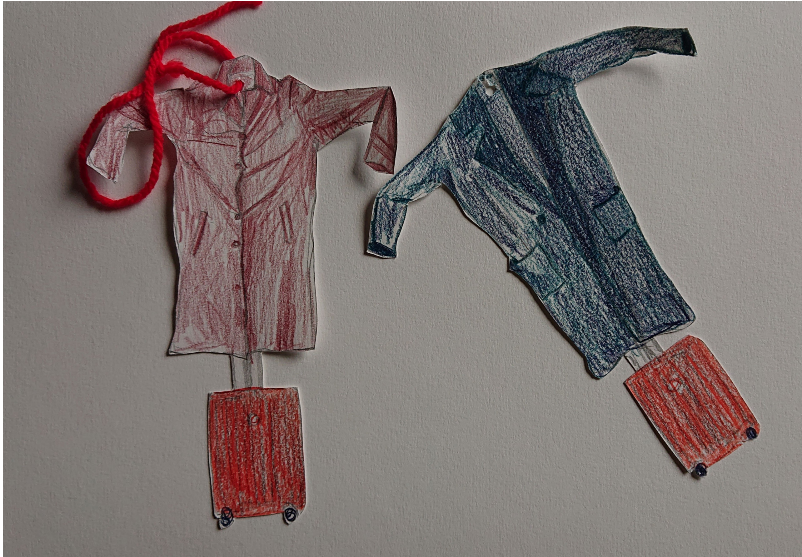
Objets de la performance