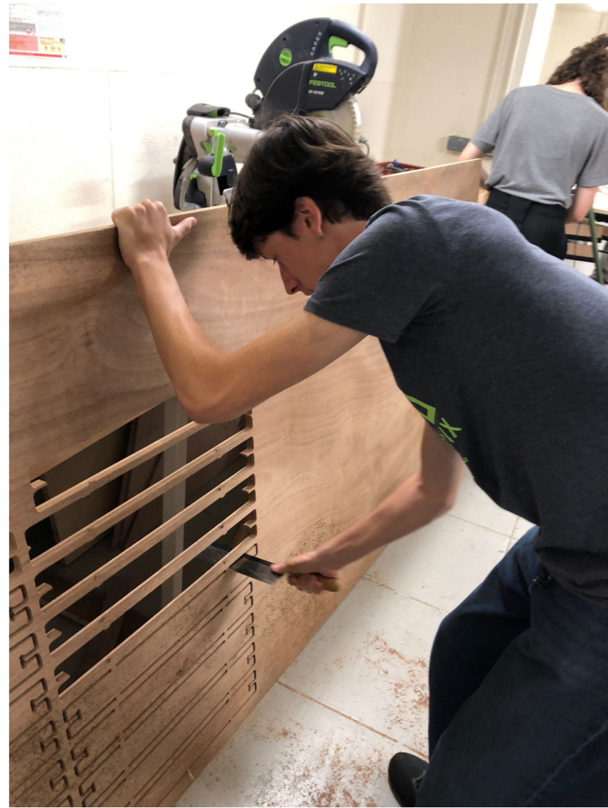
découpe des pièces